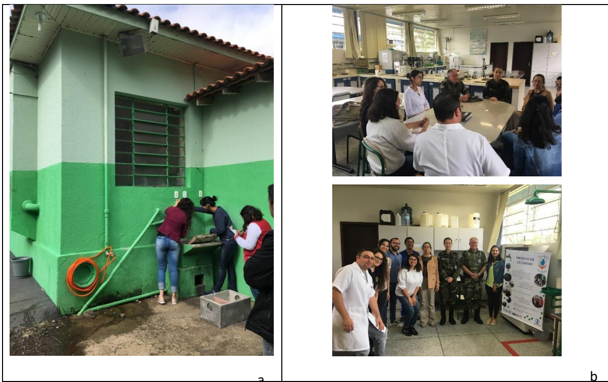
Figura 2 – Execução do projeto: a) Acadêmicas em visita de inspeção realizando medições no início do projeto e b) equipe entregando o projeto pronto.