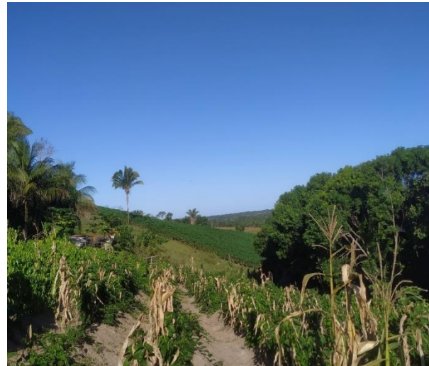
Figura 1 - Plantação de milho