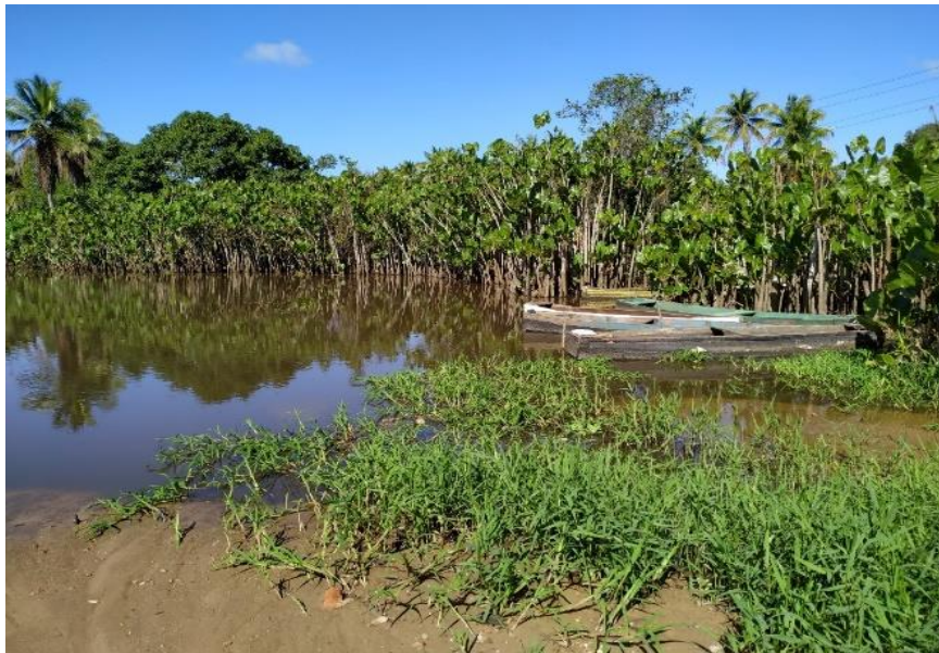
Figura 3 - Rio Gramame