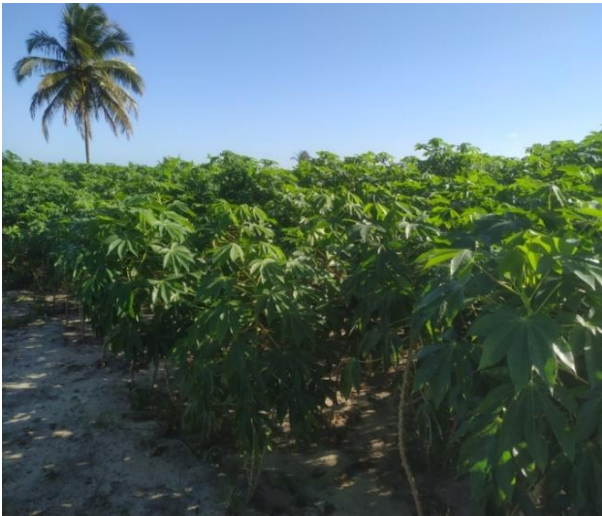
Figura 2 - Plantação de macaxeira