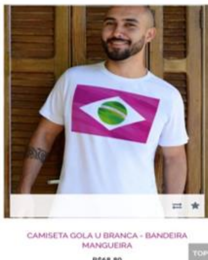
Figura 7 – Camiseta Mangureira