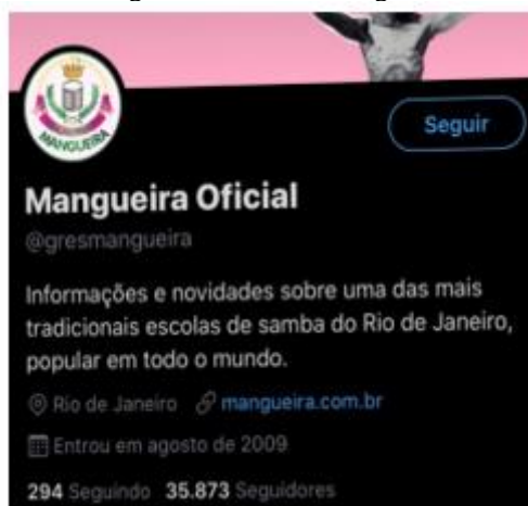
Figura 5 – Twitter Mangueira