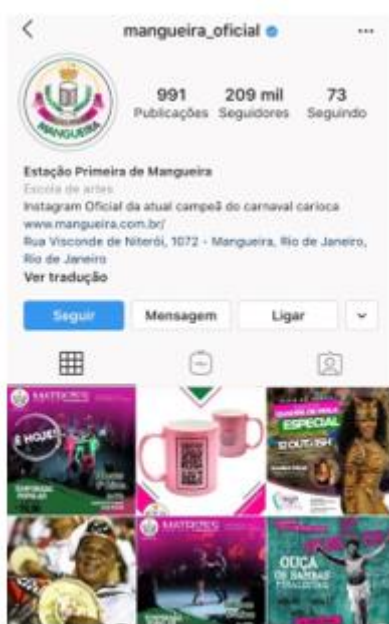
Figura 3 – Instagram Mangueira

Tendo como redes sociais o Instagram (Figura 3), o Facebook (Figura 4) e o Twitter (Figura 5), a Mangueira leva seu desfile e para as redes sociais, promovendo essa expansão da marca e da narrativa dos desfiles, promovendo esse rompimento de mídias.