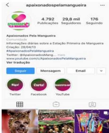
Figura 6 – Fã-clube Mangueira