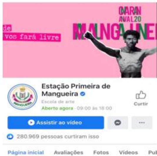
Figura 4 – Facebook Mangueira