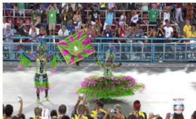
Figura 2 – Casal Mangueira

Ao mesmo tempo em que passava pela passarela do samba, o espetáculo era transmitido ao vivo pela Rede Globo de Televisão e as plataformas pertencentes ao mesmo grupo detentor dos direitos de transmissão dos desfiles das escolas de samba do carnaval do Rio de Janeiro. (Portal G1 e Globoplay). (Figura 2).