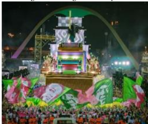
Figura 1 – Mangueira na Sapucaí