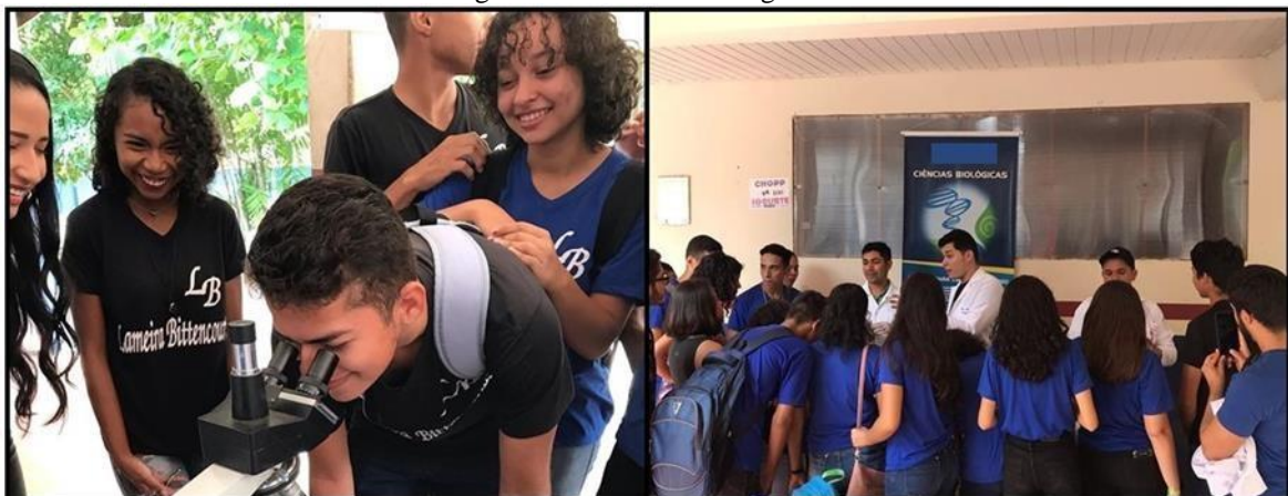
Figura 2. Estande de biologia.

Durante todo o período da feira vocacional foram feitas diversas apresentações, porém, a equipe do trabalho estava responsável em apresentar o curso de biologia e áreas afins, prestando esclarecimentos relativos ao curso (Figura 2).