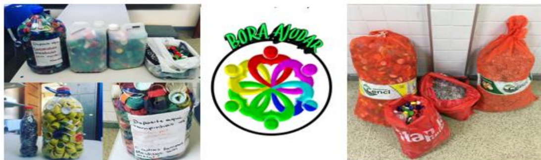
Figura 2. À esquerda: Imagem de uma das arrecadações feitas pelo projeto (após cerca de 2 meses) a qual evidencia os resíduos coletados (tampas plásticas e lacres de alumínio) e os coletores. Ao centro: Logotipo do projeto Bora Ajudar, desenhado pelo estudante Erlan Ribeiro Nascimento. À direita: Armazenamento dos resíduos coletados após retirada dos coletores, para novas arrecadações.

A implementação da coleta de resíduos na escola se deu por organização de coletores em pontos estratégicos (lugares bastante visitados da escola, como a entrada