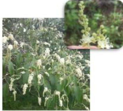
Figura 1: Croton sonderianus em seu habitat natural com ênfase nas inflorescências