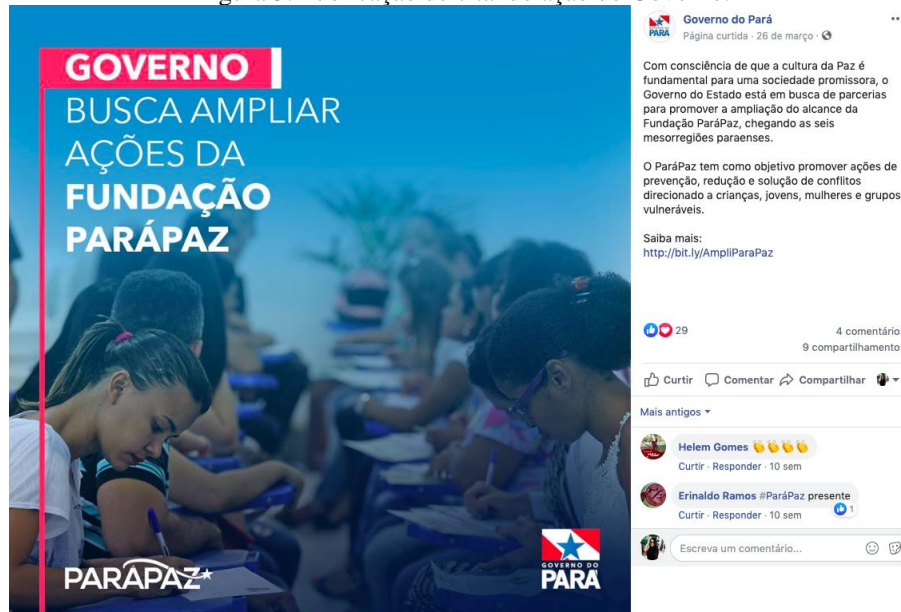
Figura 5: Publicação de citando ação do Governo.

Retomando o conceito de Comunicação Pública, segundo Brandão (2009), de que “é uma forma legítima de um Governo prestar contas e levar ao conhecimento da opinião pública os projetos, ações, atividades e políticas que realiza e que são de interesse público”, foram identificados 27 posts, sendo 22 imagens, 3 links, 1 vídeo e 1 álbum com conteúdos institucionais que divulgam ações como: campanhas educativas, premiações, reuniões governamentais, entre outros.