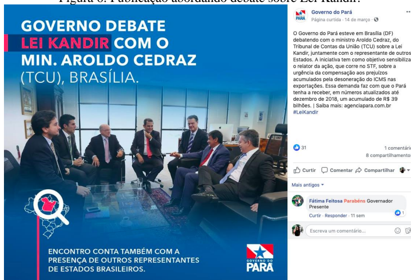
Figura 6: Publicação abordando debate sobre Lei Kandir.

A partir dessa análise, podemos compreender que o papel de protagonismo da persona do perfil não se confunde com a figura da pessoa física do gestor, ou seja, a FanPage do Governo do Pará não dá destaque ao governante, mas sim, aos feitos realizados pelo Governo do Pará, um órgão estatal composto por suas secretarias e instituições, que tem como tarefa, primordialmente, servir aos interesses dos cidadãos. Ressalta-se que governador possui presença digital com perfis pessoais em canais como: Facebook , com 245 mil curtidas; Twitter , com 25 mil seguidores; e Instagram , com 114 mil seguidores; que não foram alvo deste estudo, uma vez que o objetivo desta pesquisa é analisar o perfil institucional do Facebook do Governo do Pará.