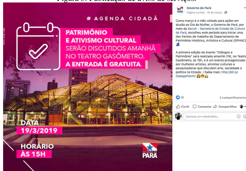
Figura 3: Publicação de aviso de serviços.

Essa categoria, que somou um total de 36 publicações durante o período analisado, aparentemente corresponde a conteúdos de utilidade pública, relacionado a algum fato que seja considerado importante para o cotidiano da população, com informações sobre serviços e processos governamentais. Dentre os tipos de publicações, somou-se 31 imagens, 3 links e 2 vídeos. Nos assuntos levantados no estudo foi possível notar informações como eventos culturais, prestação de serviços gratuitos, dicas sobre o Carnaval no Pará e outros.