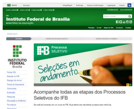
Figura 1. Página principal do sítio IFB.

Por meio de uma análise quantitativa dos dados obtidos, percebe-se que os índices alcançados pelo sítio do IFB são superiores àqueles obtidos na avaliação do sítio do IFSC. Dessa forma, o sítio do IFB (Fig. 1) fica caracterizado em possuir uma maior acessibilidade em seu conteúdo.