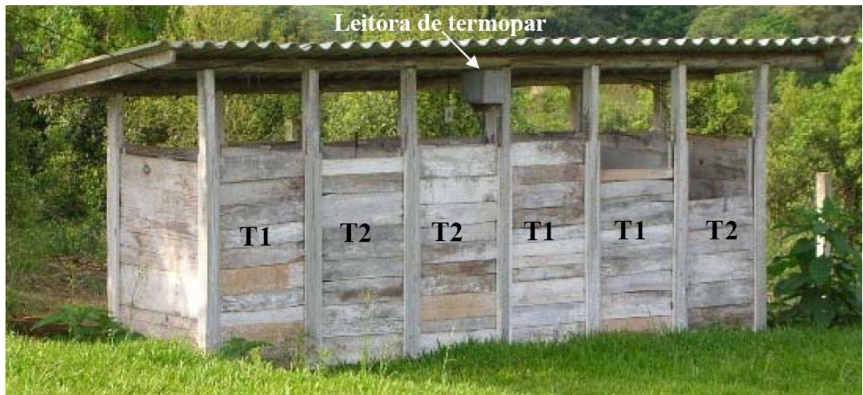
T1 = palhada da soja; T2 = casca de arroz.

Na figura 1, as composteiras para animais mortos foram construídas de madeira para receber o substrato juntamente com os animais mortos. De acordo com Embrapa, são construídas em alvenaria de tijolos ou em madeira, com localização a pelo menos 10 metros do aviário.