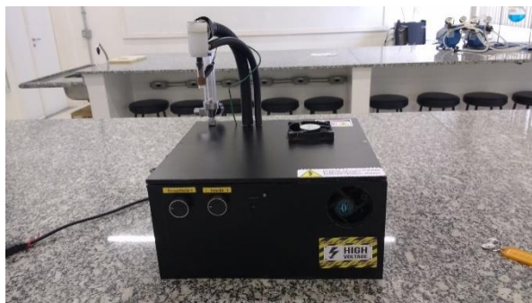
Figura 1: Gerador de plasma frio à pressão atmosférica

Controlando os parâmetros elétricos (tensão e frequência aplicada na faixa de 0 KV a 20 KV e de 500 Hz a 1,29 KHz respectivamente), o fluxo de gás (vazão controlada por um manômetro na saída do cilindro de argônio, de 0 L/min a 25L/min) e a distância de tratamento da amostra (0 cm a 5 cm), foi possível variar a intensidade do plasma gerado. O controle da intensidade pode aumentar ou diminuir a produção de radicais livres no plasma. Um fato importante a ser ressaltado é que o gerador de plasma não apresentou fugas de corrente. Ao se trabalhar com a alta tensão muitas das vezes ocorre a presença e formação de fugas elétrica (arcos) em lugares indesejados. Isto ocasiona perdas elétricas e a possibilidade de choque elétrico ao usuário, fato não observado neste projeto. O gerador é mostrado na figura 1.