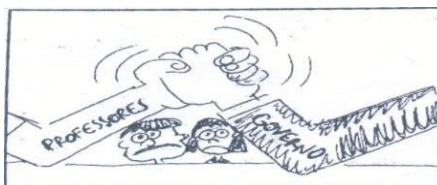
Figura 01 - Charge

Charge. Jornal a Folha de Boa Vista, 2012.